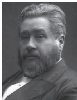
C.H. Spurgeon 1834 – 1892

Zelf heeft u Zijn Woord gegeven en dat zal blijven staan tot in eeuwigheid, omdat Hij Zijn Woord nooit zal herroepen.